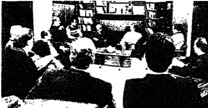
مع المجلس التقيدي لاتحاد الكتل المتحد للعمل

وجه رئيس مجلس الوزراء العماد ميشال عون، مساء أمس رسالة الى المغتربين اللبنانيين والمغتربين من اصل لبناني في الولايات المتحدة . . .